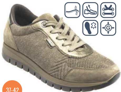
CS/8057 IVORY CS/8057 JET