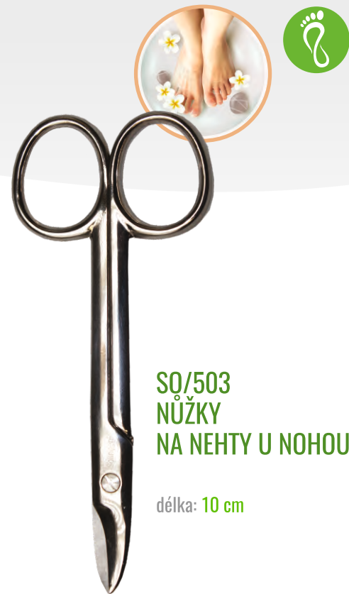
SQ/503 NŮŽKY NA NEHTY U NOHOU