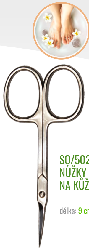
SQ/502 NŮŽKY NA KŮŽI ÚZKÉ