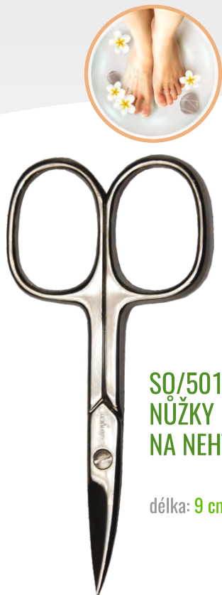
SQ/501 NŮŽKY NA NEHTY