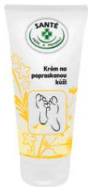
MU/132 KRÉM NA POPRASKANOU KŮŽI 200 ML

Výborný přípravek pro zklidnění a zvláčnění pokožky nohou. Krém je vhodný pro ošetření popraskané pokožky nohou, ulevuje pocitům svědění. Obsahuje Tea Tree Oil, který má antimykotické účinky.