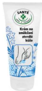
MU/133 KRÉM NA ZMĚKČENÍ ZTVRDLÉ KŮŽE 200 ML

Výborný přípravek pro zklidnění a zvláčnění pokožky nohou. Krém je vhodný pro ošetření popraskané pokožky nohou, ulevuje pocitům svědění. Obsahuje Tea Tree Oil, který má antimykotické účinky.