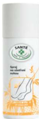
AV/100 SPREJ NA OŠETŘENÍ NOHOU 150 ML

Účinný pomocník pro ošetřování ztvrdlé a namáhané pokožky nohou. Kyselina mléčná působí protizánětlivě. Panthenol pokožku zjemňuje a regeneruje. Vitamin E má silný antioxidační účinek a podporuje žilní cirkulaci.